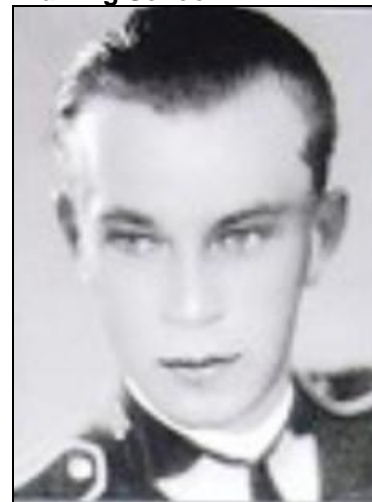
Velitel čsl. výsadkových jednotek v Itálii

Intrastitive Antropoid SILVER A, SILVER B, CLAY